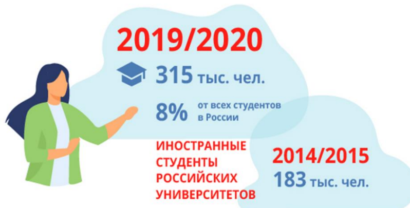
Рис.1 Рост числа иностранных студентов в России