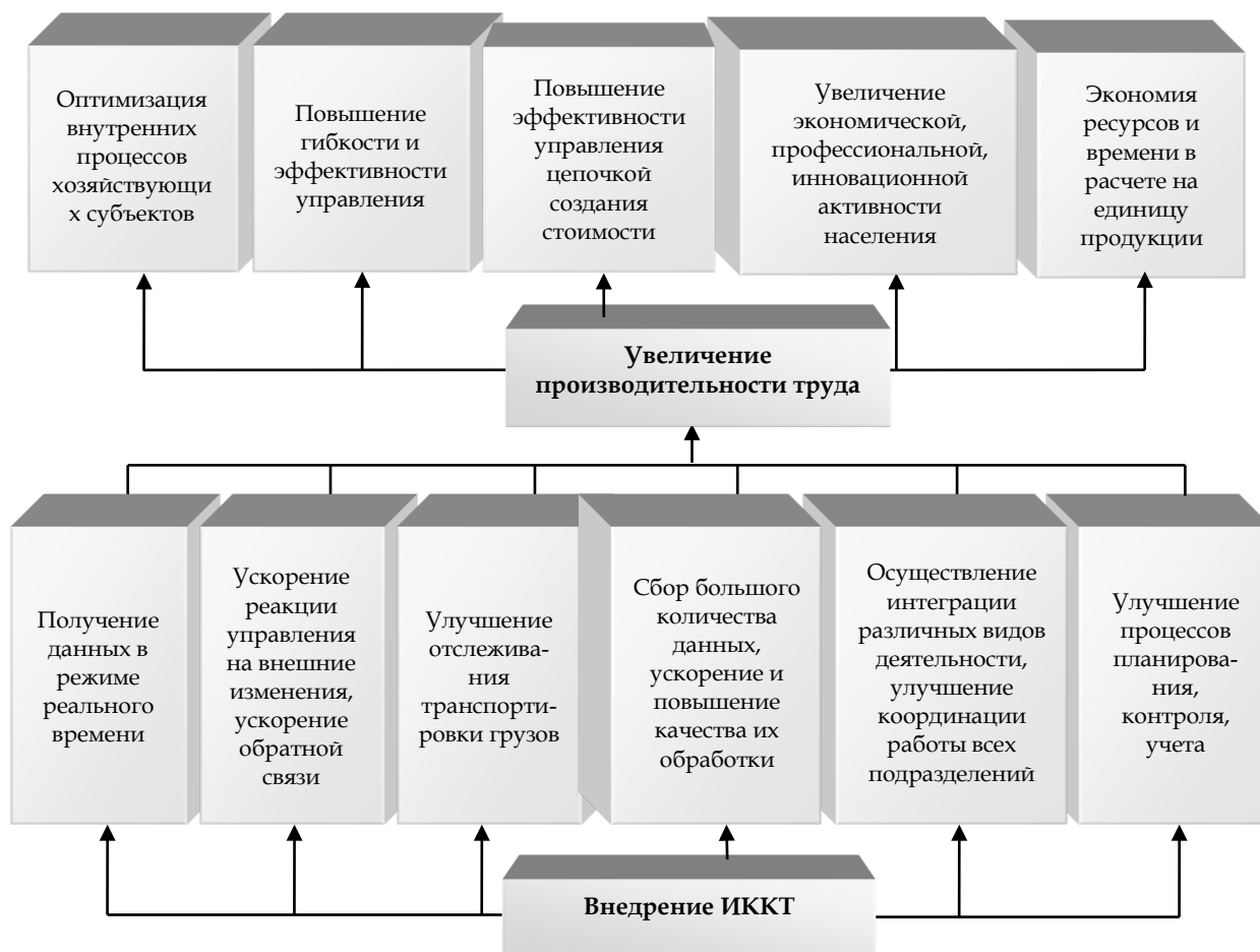
Рис. 1. Влияние ИККТ на развитие экономики и общества посредством повышения производительности труда

экономической инфраструктуры и многих других факторов.