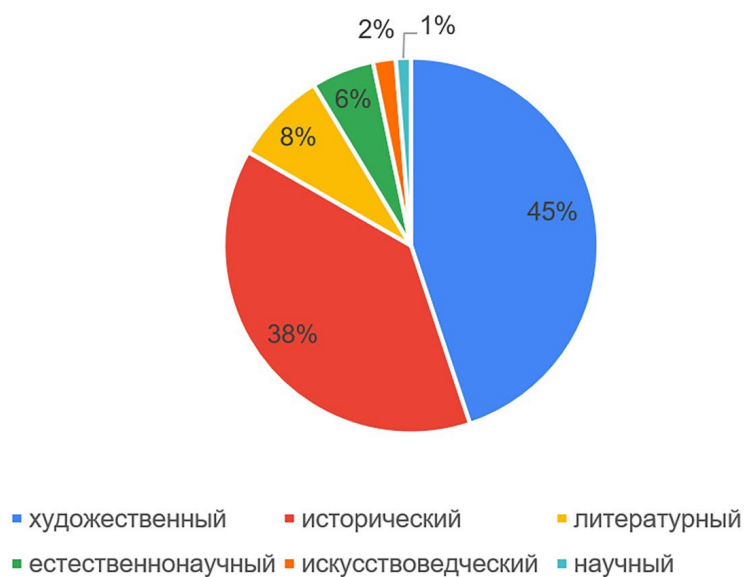
Диаграмма 1. Распределение музеев по профилю

Государственные музеи составляют почти 2/3 контента от всех организаций, занимающихся в той или иной мере музейной деятельностью. При этом более 51 % составляют аудиогиды музеев федерального значения. Подобная ситуация понятна, как по причине большего финансирования, так и штатного расписания организаций. При этом следует отметить, что почти 12 % аудиогидов формируются частными музеями.