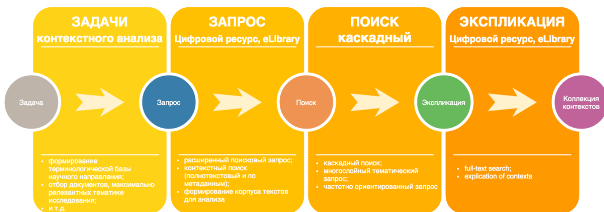
Рис. 2. Комплексное применение методов поиску, извлечению и экспликации контекстного знания для дальнейшего анализа.

При этом подходе могут быть использованы различные сетевые источники цифровых данных, предоставляющие информацию о социокультурном пространстве: